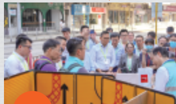
新突破 找出癥結，才能對症下藥 施政報告回應訴求，視察渠務署調查渠管錯駁個案及復修工作