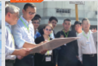
考慮政府財政狀況，重新評估及研究是否仍設置旱季節流器