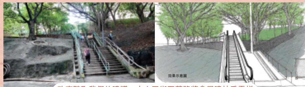
政府聽取我們的建議，大白田街石蔭路將會興建扶手電梯 我們力爭興建雙向式扶手電梯