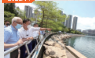
與時任環境局副局長謝展寰視察荃灣海濱 及研究加裝旱季截流器進展及選址