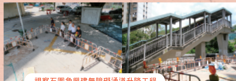
視察石圍角興建無障礙通道升降工程