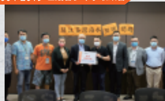
約見時任環境局副局長謝展寰 講述荃灣海濱臭味問題