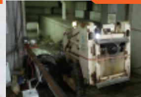
了解政府使用遙控清淤機械人進行 大河道箱型暗渠的清淤工作