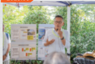
視察環保署改善荃灣海旁臭味的智慧科技儀器 了解工程情況方可向居民及時反映