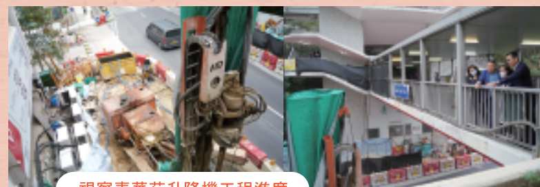
視察青華苑升降機工程進度