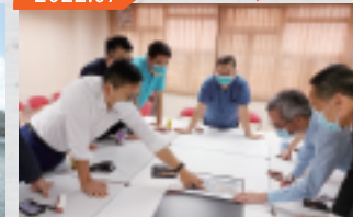
與渠務署商討荃灣海濱旱季截流器工程進展