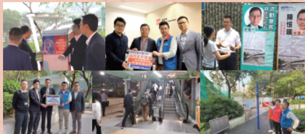
大窩口天橋扶手電梯爭取多年終於完工