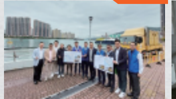
視察環境保護署及渠務署清理污水渠的工程