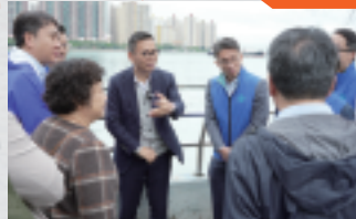
邀請受影響住戶一同參與商討及 了解政府部門有關工程進展