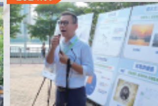
視察跨部門處理改善荃灣海旁臭味工作成果 成功將污染量及氣味濃度減少超過八成